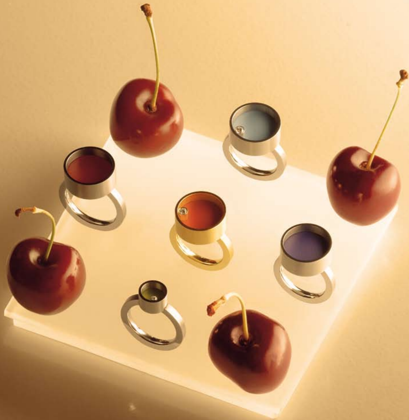
Linke Seite Carl Dau, Ringe in Edelstahl mit farbigem Lack oder Titan und Gold. Ab 235 Euro. Mit Brillant ab 355 Euro