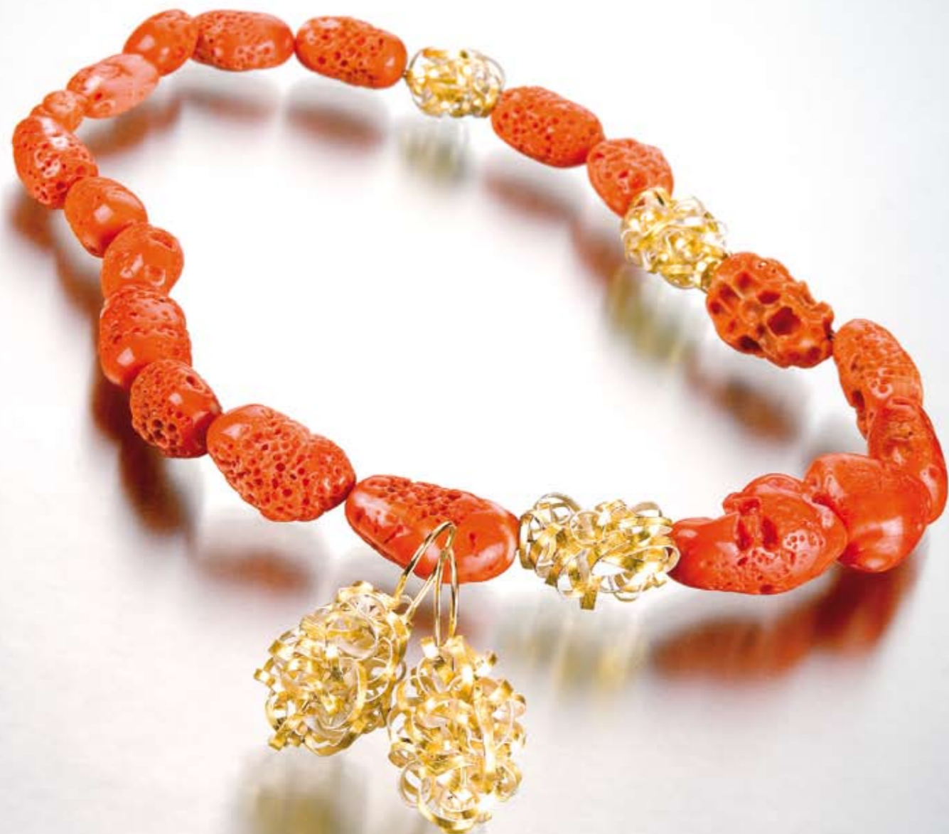
Linke Seite Halsschmuck „Clouds“, Koralle, Silber 925, Gold 900, Gold 750, mit Wechselschließe, Unikat, 1535 Euro. Ohrhänger „Clouds“, Silber 925, Gold 900, Gold 750, 580 Euro